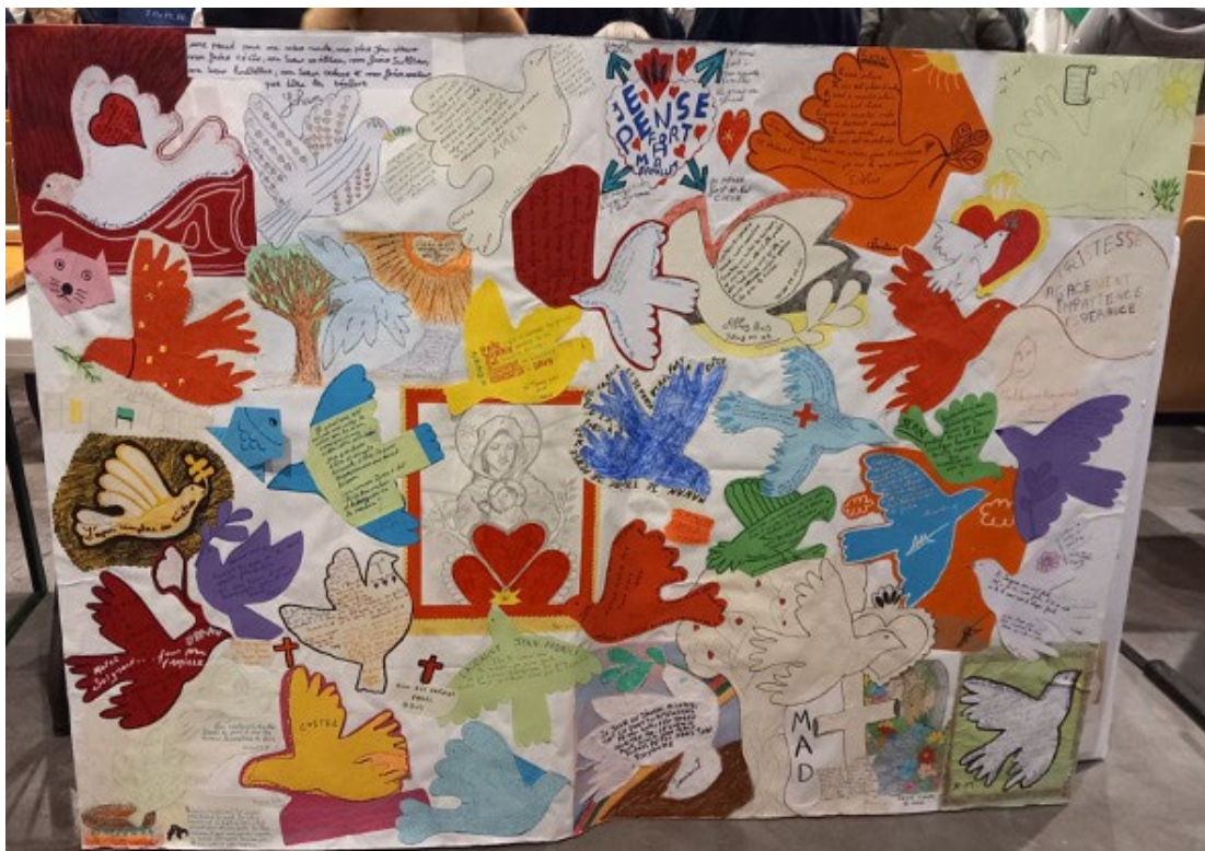
La présence de nos frères détenus fut manifestée notamment par des objets qu'ils ont fabriqués avec les matériaux disponibles en détention.