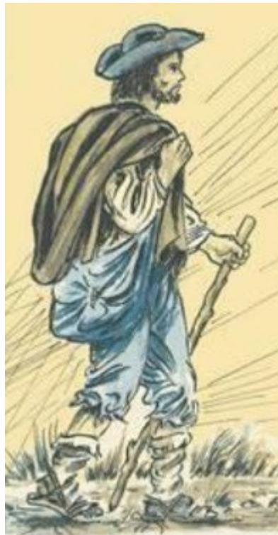
St Benoît-Joseph LABRE (1748-1783)

Humble et pauvre en toute occasion, patient et bienveillant pour tous et plus particulièrement envers ceux qui le comprenaient le moins, obéissant à ses supérieurs, prompt à satisfaire ses confrères dans le souci de les rendre heureux, Hermann-Joseph représente le modèle achevé du religieux prémontré.