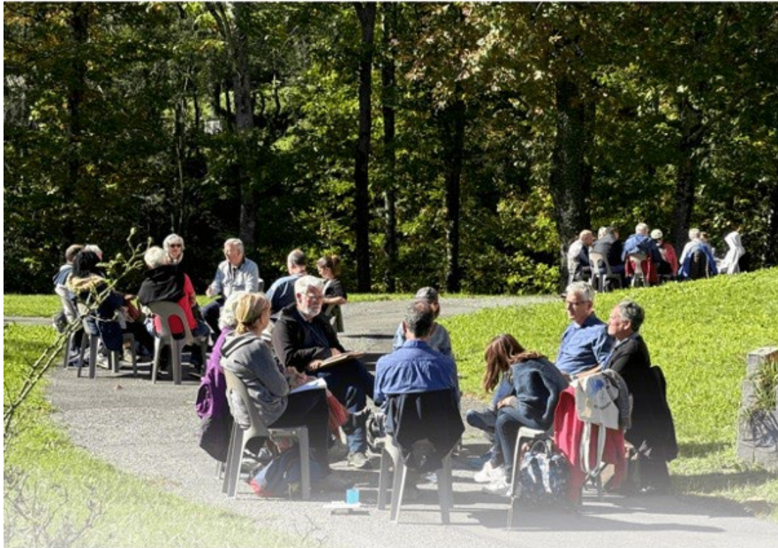
Ci-dessus, une « fraternité » lors d'une des 2 rencontres hebdomadaires.